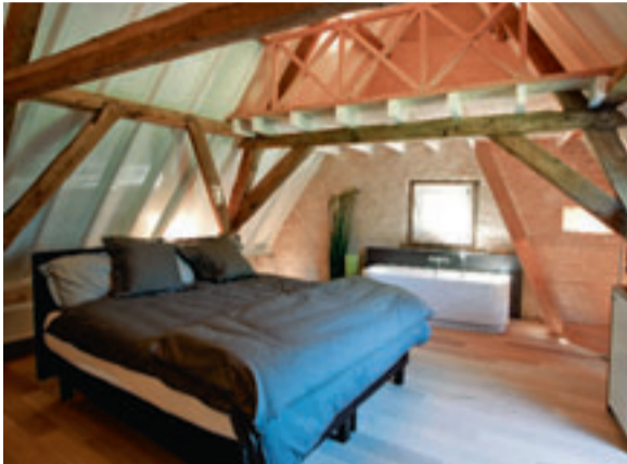
Heel mooi is het plafond met balken. Het bad staat in dezelfde ruimte als het bed.