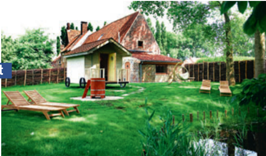
Een van de grootste troeven van Hof Ter Doest is de mooie tuin. In de strandcabine zit een sauna. Afkoelen doe je in de dompelton.

We sliepen als een roos, dankzij de zalige rust die er heerst in het weidse polderlandschap. Er stond een uitgebreid ontbijtbuffet klaar met heerlijk gekookte eitjes. Het restaurant serveert visgerechtten als zeetong, kreeft, Zeebrugse garnalen en